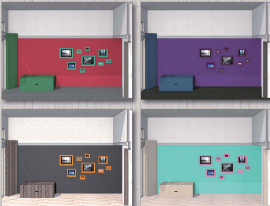
カラーバリエーションの一例・・・