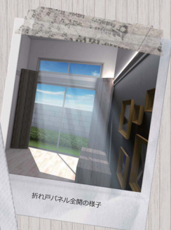
折れ戸/パネル全開の様子