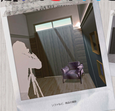
ソファなど、商品の鑑賞

「P.S. Room」は、Photo Studio of the P.S. と、道仲のP.S.を掛け合わせたもので、趣味を趣味で終わらせるのほったいない、趣味部屋で、趣味だけに 空間し、ギャラリーにもできるようなたPLANです。趣味部屋「P.S. Room」からスタートしよう!