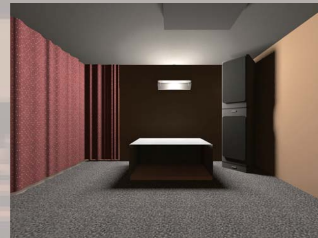
▲カーテンでしきり1階と分離