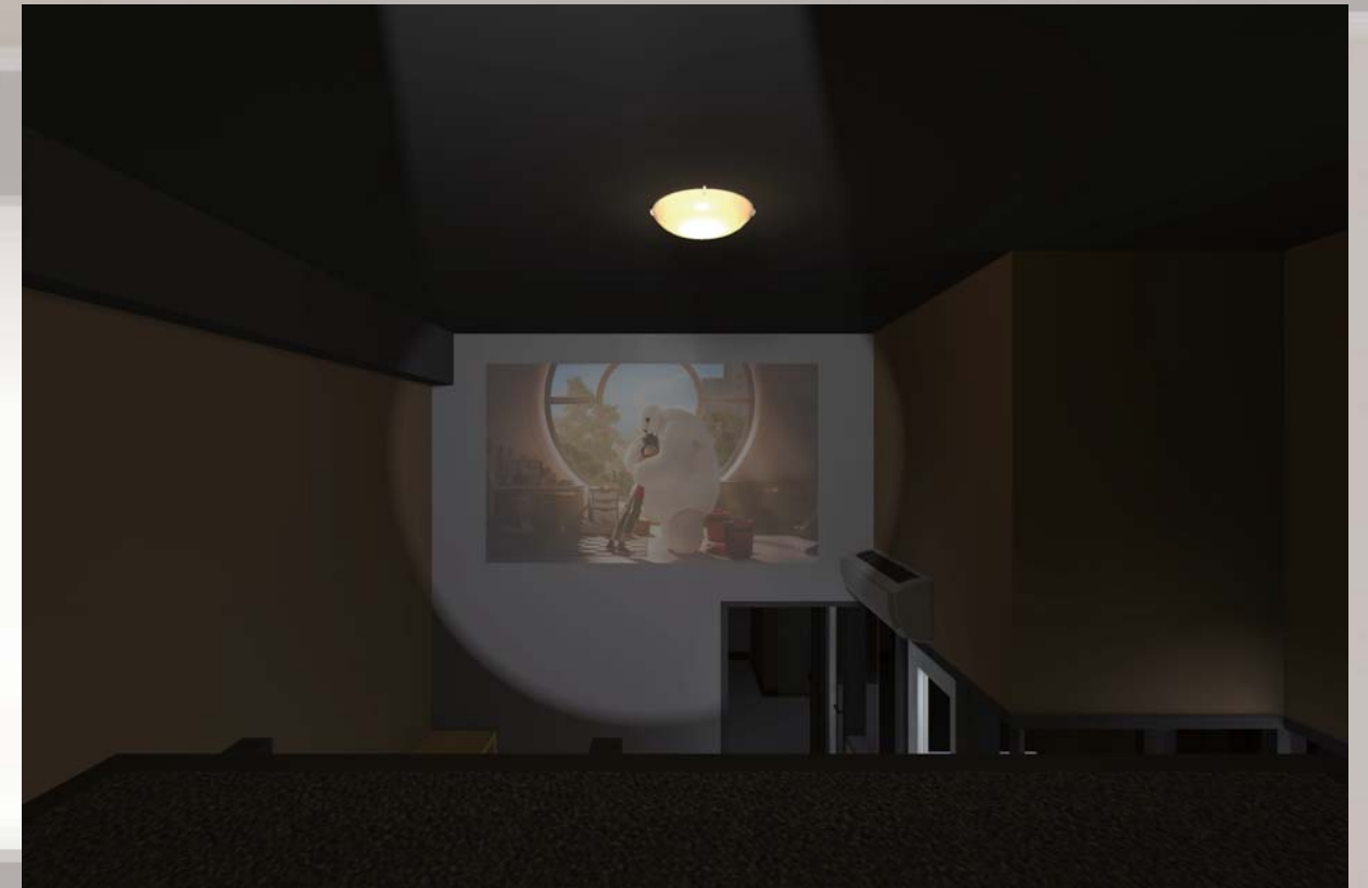
▲ロフトからの映画上映