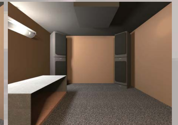
▲スピーカーで臨場感